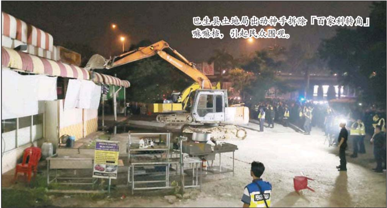
巴生县土地局出动神手拆除「百家利转角」 麻麻档，引起民众围观。