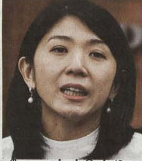
கோலாலம்பூர், செப. 12 -