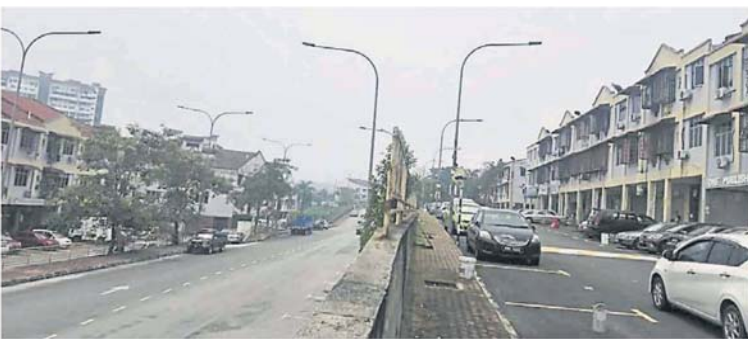
9 月 2 日起开始执法后，民众不再免费泊车。