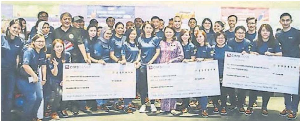
■ 妇女、家庭及社会发展部副部长杨巧双（右7）在特殊奥林匹克保龄球联赛活动现场亦移交支票。