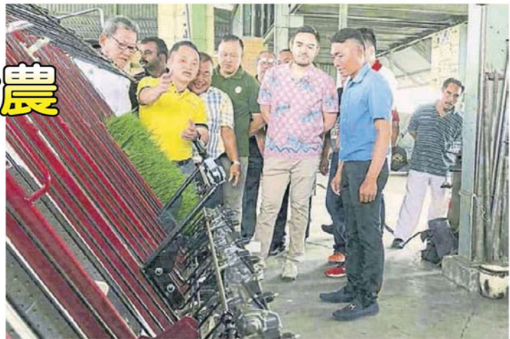
■黄瑞林（左）向东姑阿米尔沙殿下（右2）讲解插秧机的操作方式，右为林荣坤。

出席者包括大港国会议员慕斯利敏、沙白安南国会议员拿督莫哈末法西亚、雪州反对党领袖利詹依斯迈、沙白州议员慕斯达因、双溪班让州议员英然、沙白县各政府部门代表，与新协发父子有限公司负责人林荣坤。