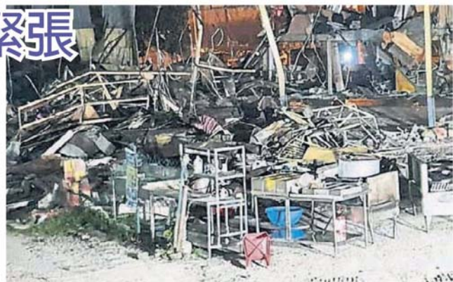
■执法人员在拆除行动前，协助把工具全部搬到餐馆外。

土地局因此于周三晚，根据1965国家土地法典第425条文，展开拆除行动；根据该条例，