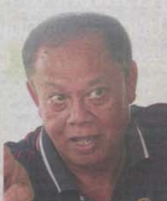
Danker: "A budget should be allocated for maintenance."