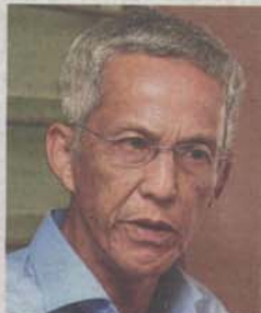
Esham: "PJ mayor should get feedback from community leaders."