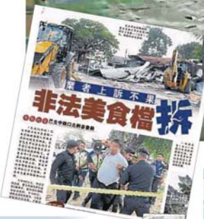
左图：当局给予足够时间让业者将店内的物品给搬空才动手拆店。 右图：当局出动种子，将嘛嘛店的建筑一一拆除。

执法当局从8月21日至今，在约20天的时间内，竟然三度在巴生永安镇和百家利拆除三座建筑物，从一间神庙到小贩中心，到最新的则是昨晚的嘛嘛店，令到一些人把当地州议员拿督邓章钦当作“箭靶”，并在社交媒体宣泄不满。