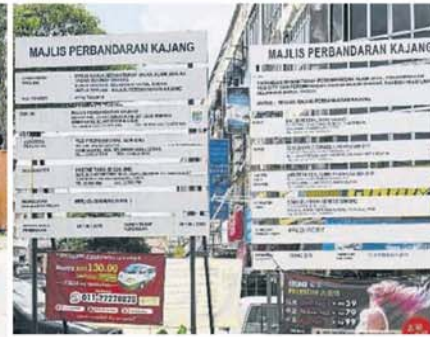
■市议会在爱兰镇路口的工程告示牌显示，爱兰镇工路提升工程原订5月竣工。