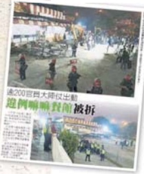
▲ 逾200名警員出動，違例嘛嘛餐館被拆