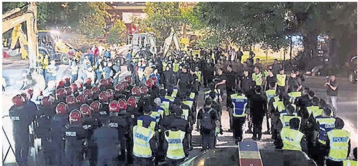
■逾170名警员和联邦后备部队，全面戒备，防止有人造乱。