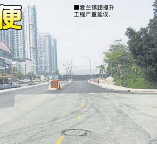
■爱兰镇路提升工程严重延误。