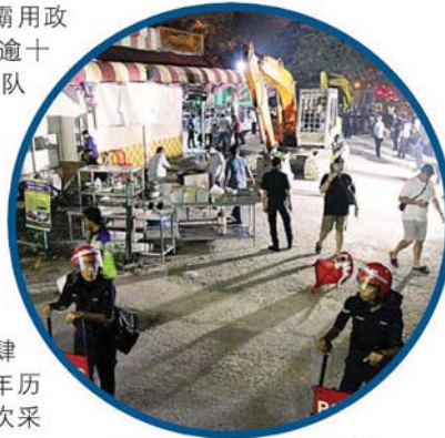
镇暴部队受召到现场戒备。

据了解，嘛嘛食肆是于 2006 年开始营业，当时获得执法单位发出临时地契与营业执