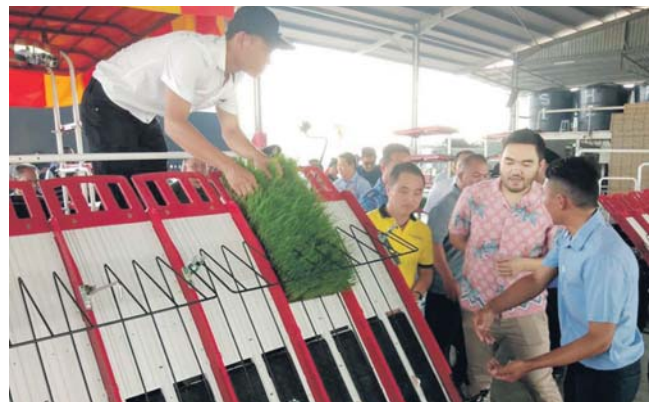
Tengku Amir Shah berkenan berangkat ke Syarikat Sin Hiap Huat dan mengikuti sesi penerangan dan lawatan semaian benih padi.

Baginda turut menunjukkan kemahiran menaikkan hasil laut menggunakan pukot hanyut.