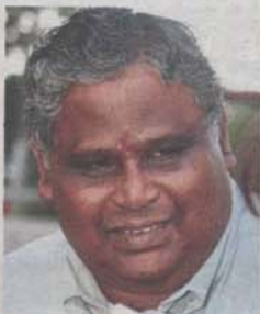
Selva: "I feel MBPJ is allocating more money to newer areas."