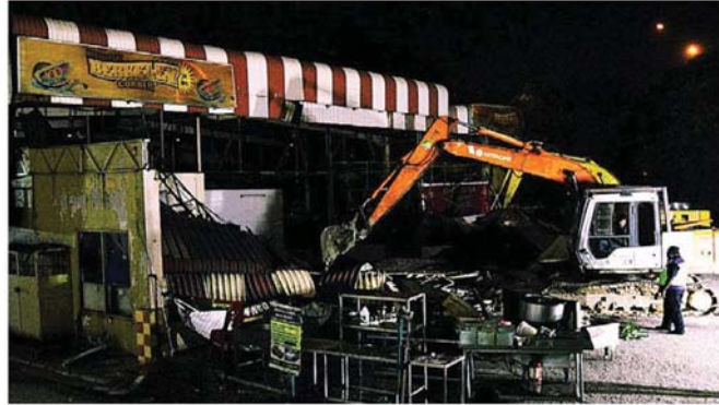
非法经营数年的嘛嘛食肆，终于被“正法”拆除。