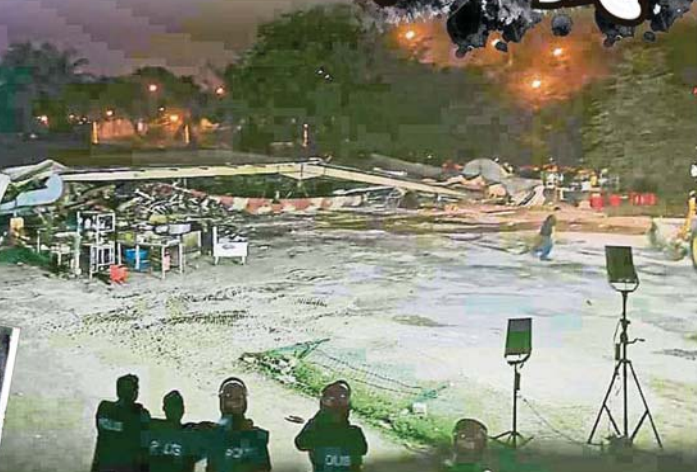
经营的15年的嘛嘛店在11日晚上被执法当局推倒了。