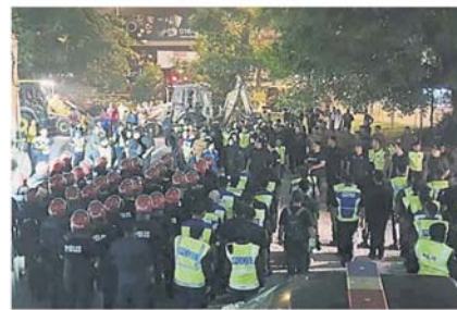
约 170 名警员和警官在现场待命，维持秩序。