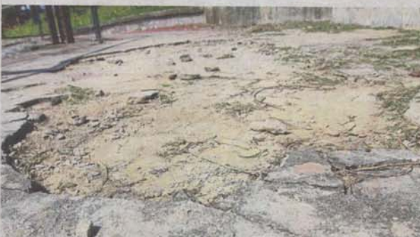
Petaling Jaya residents say roads should be resurfaced regularly as if ignored, repair works will cost more.

"I hope the city council will provide sufficient budget allocations for older neighbourhoods