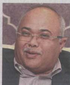
Sayuthi: "Priority will be given to committed expenditure."