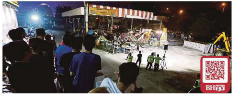
Sebuah restoran beroperasi secara haram berhampiran Bulatan Berkeley, Klang dirobohkan malam kelmarin.

Sementara itu, beberapa video tular melalui media sosial mendakwa berlaku kekecohan dan