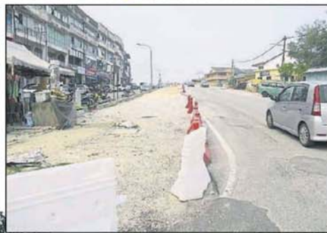
■道路加宽工程做到一半便停顿。