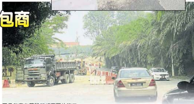
■承包商在蕉赖双威花园外施工。

“一旦衔接道路开放，爱兰镇十字路口预计10月可启用。” 此外，他透露，You City衔接蕉赖加影