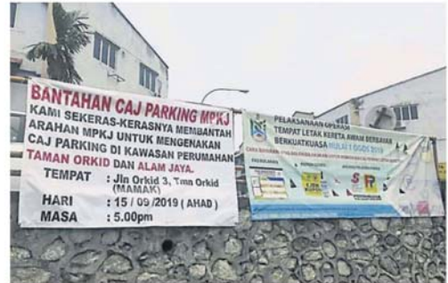
居民把反对停车收费的横幅，挂在加影市议会停车收费的横幅旁，形成强烈对比。