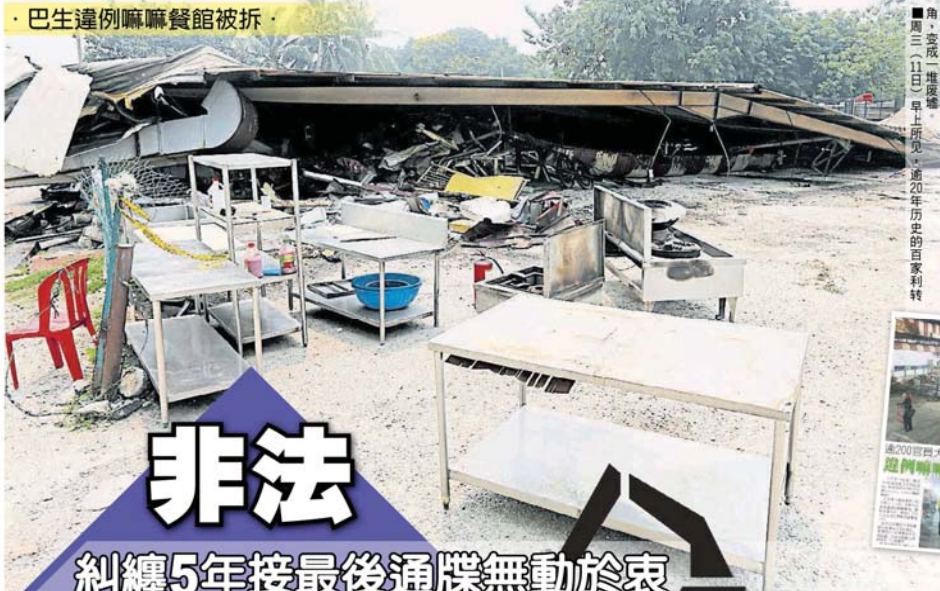
· 巴生違例嘛嘛餐館被拆 ·

Provided for client's internal research purposes only. May not be further copied, distributed, sold or published in any form without the prior consent of the copyright owner.