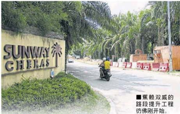
■蕉赖双威的路段提升工程仿佛刚刚开始。

Provided for client's internal research purposes only. May not be further copied, distributed, sold or published in any form without the prior consent of the copyright owner.