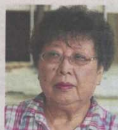
Thong: "Pre-budget survey a good idea but it should be user-friendly."