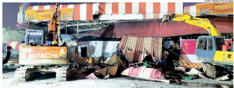
Restoran terkenal berhampiran Bulatan Bukit Raja yang dirobohkan dalam satu operasi kelmarin.

Menurutnya, tindakan penguatkuasaan diambil di bawah Seksyen 425 Kanun Tanah Negara 1965 berikutan berlaku pencerobohan tanah kerajaan melibatkan sebahagian rizab kawasan lapang dan Lebuhraya