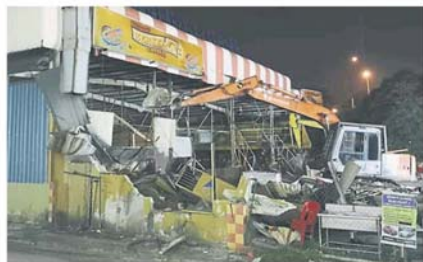
当局出动两台神手展开拆除行动。