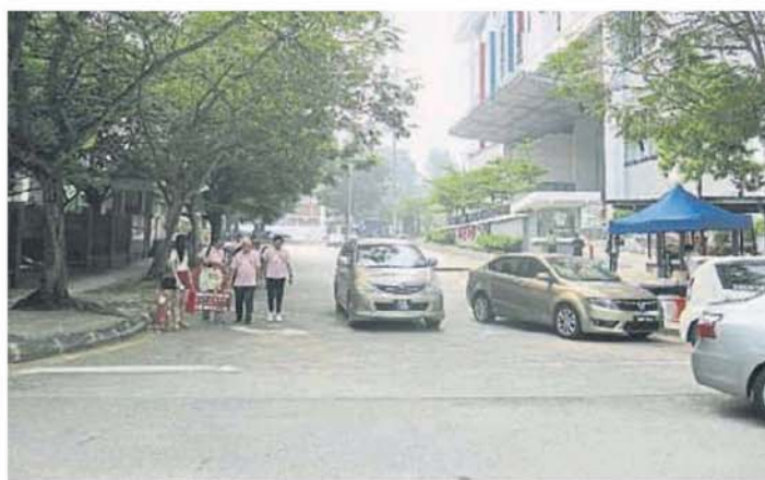
■拉曼大学前面的道路将封锁进行中秋园游会。