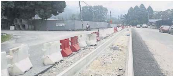
路中筑起分界堤后，从爱兰镇组屋无法右转到大路，而从双威蕉赖也无法右转往爱兰镇方向。